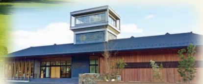
シーサイドセンター外観